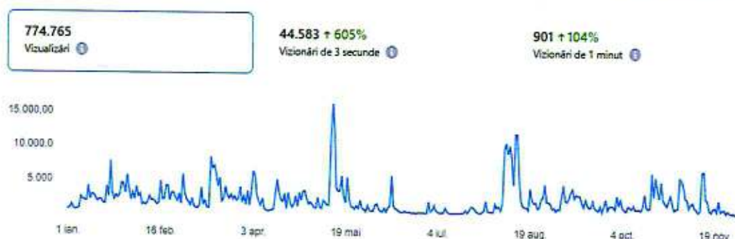
Figură 1. Vizualizări pe pagina de Facebook a Teatrului Colibri (pagina principală) (01 ianuarie - 31 decembrie 2025)

Teatrul Colibri a devenit mult mai vizibil în comunitate și datorită apropierii de public prin activitățile sale, precum Săptămâna Teatrului , Noaptea Muzeelor , Misiunea