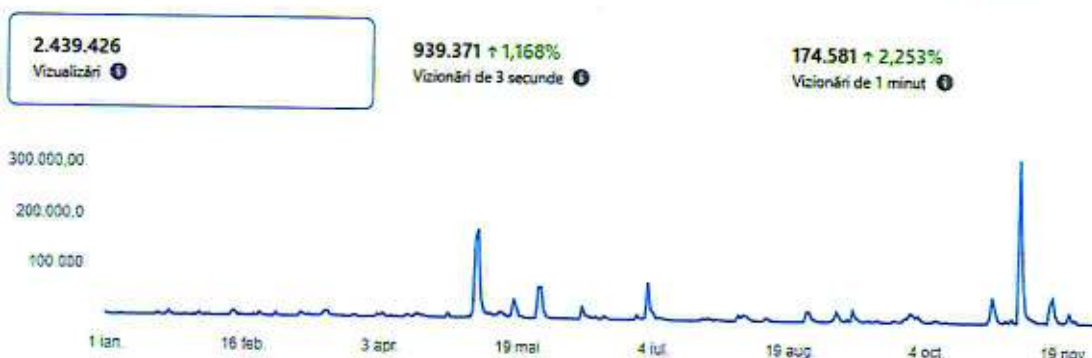
Figură 2. Vizualizări pe pagina de Facebook a Secției Folclor „Maria Tanase” (01 ianuarie - 31 decembrie 2025)

Nu în ultimul rând, teatrul are parteneriate media cu instituțiile de presă locale, dar și apariții în presa națională și internațională (CronicaOlteniei.ro, Radio Oltenia, Radio România Cultural, JurnaldeOltenia.ro, ESTV.ro, SFIN.ro, CraiovaForum.ro, Oltenașul.ro, DCNews.ro, Adevărul.ro, RomâniatTV.net, Oltenia 3TV, Antena3.ro, ObservatorNews.ro, Indiscret.ro, ȘtiriCraiova.ro, ViaOltenia.ro, StiriProTv.ro, Libertatea.ro, PlayTech.ro, Discovery Dolj.ro, ProDiaspora.de, Cronica TV, TVR Craiova, AșaELaCraiova.ro, Oltenia TV, Dolj TV, Nmedia.ro, Gândul.ro, Tele U Craiova, Ziarul Lupa, Reporter24.info, InfoInsider.ro, SăptămânaFinanciară.ro, Republica TV, Teatrul Azi, RoyalsBlue.com, TVR 1, TVR Info, ETNO TV; Emi TV, HotNews.ro, Money.ro, StaredeFapt.ro, Cuvântul Libertății, JurnaldeCraiova.ro, GDS.ro, TopSecretCraiova.ro, AvangardeNews.ro,