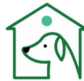
CENTRU ADOPTĂII CANINE