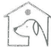
CENTRU ADOPTII CANINE