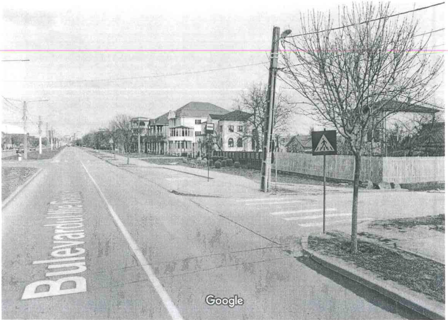
Data preluării imaginii: apr. 2022